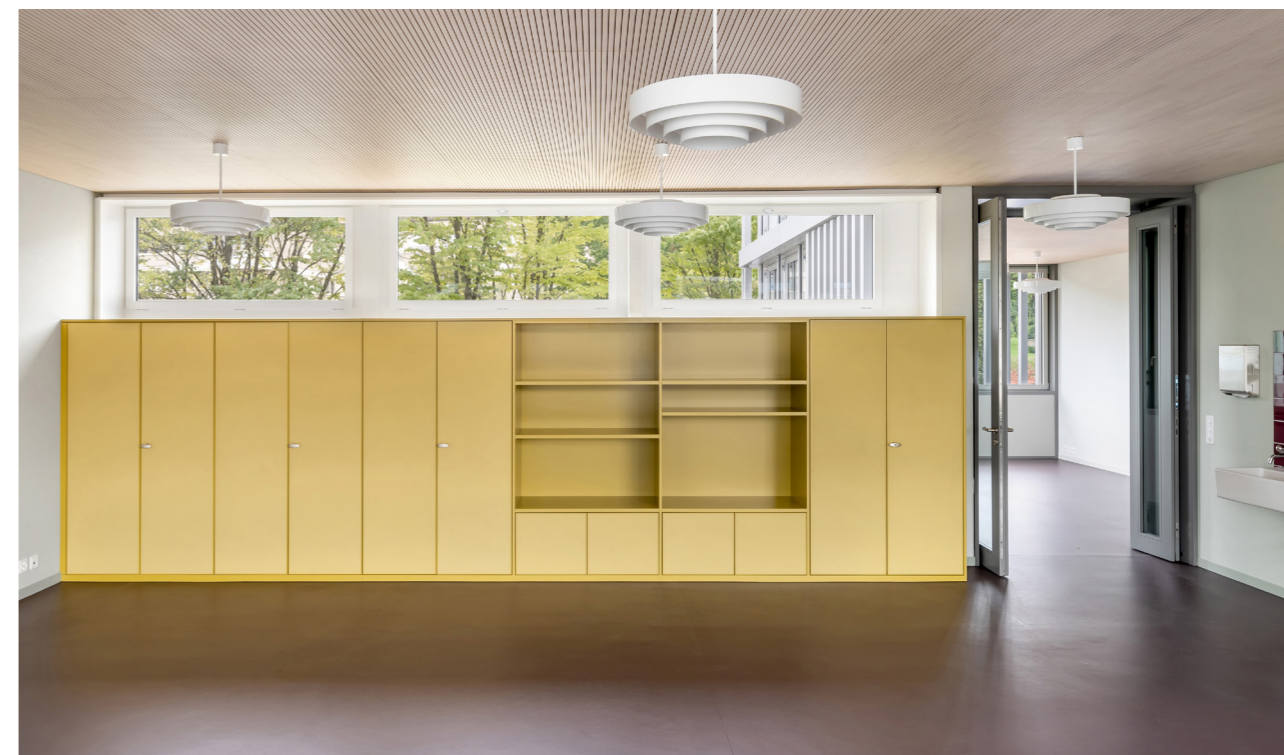
Istituti scolastici Hofmatt 1 e 2, Meggen

Esempio ufficio 129,7m 2 , Tulux. Ristrutturazione della vecchia illuminazione FL attraverso una progettazione illuminotecnica professionale e l'utilizzo di apparecchi a sospensione AREA con comando intelligente a un prezzo dell'elettricità di CHF0,35/kWh.