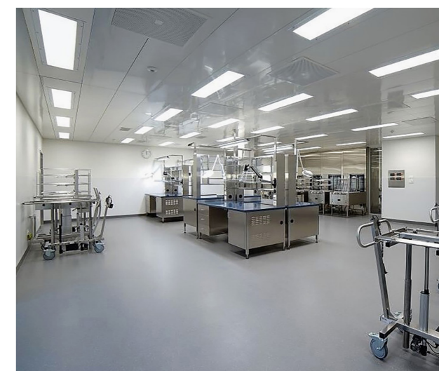
Hôpital de Muri (AG) Rénovation à l'aide d'un luminaire conçu pour les salles blanches et doté d'obturateurs à plusieurs niveaux.