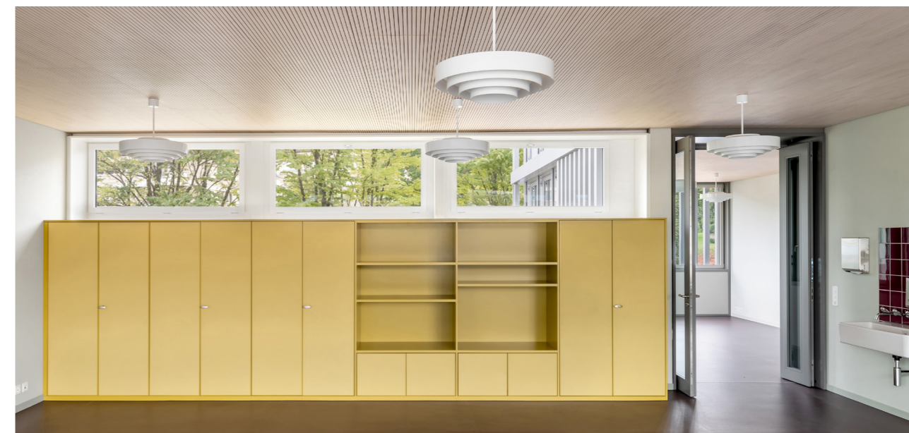
Bâtiments scolaires Hofmatt 1 et 2, Meggen

Exemple bureaux 129,7 m 2 , Tulux. Rénovation de l'ancien éclairage par tubes fluorescents avec planification professionnelle de l'éclairage et utilisation de penditifs AREA avec commande intelligente, pour un prix de l'électricité de 0.35 CHF/kWh.