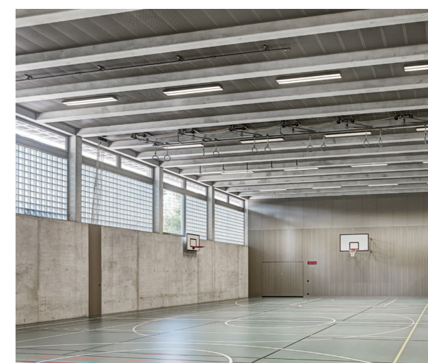
Centre sportif de l'école de Feld, Wetzikon Rénovation à l'aide du luminaire LED SPLIT, conçu pour les salles de sport.