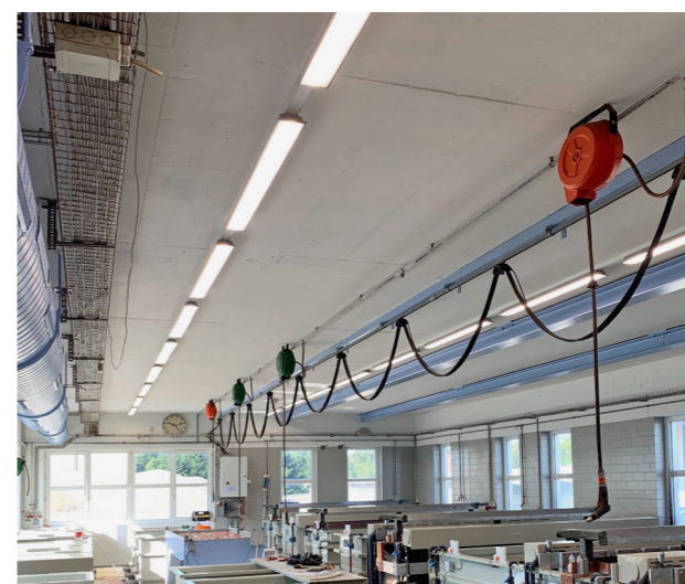
Anox AG, usine de galvanisation, Affoltern am Albis Remplacement de l'ancien éclairage à tubes fluorescents par le luminaire industriel PLANK installé sur le système de rails TURBO.