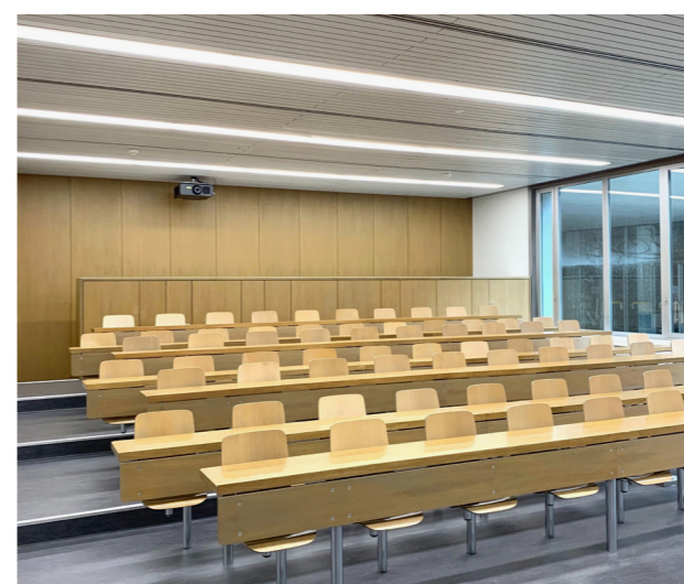
Amphithéâtres de l'EPFZ, Zurich Remplacement de l'ancien éclairage par un éclairage encastré conçu sur mesure, avec colonnes d'aération pour le raccordement de la conduite de sortie ou d'entrée d'air.

Nous proposons tous les services ayant trait à la rénovation, de l'évaluation des besoins à la conception et à l'utilisation des produits d'éclairage optimaux, en passant par la planification de l'éclairage adaptée aux utilisateurs. Faites confiance à notre longue expérience acquise au cours de nombreux projets réalisés avec succès.